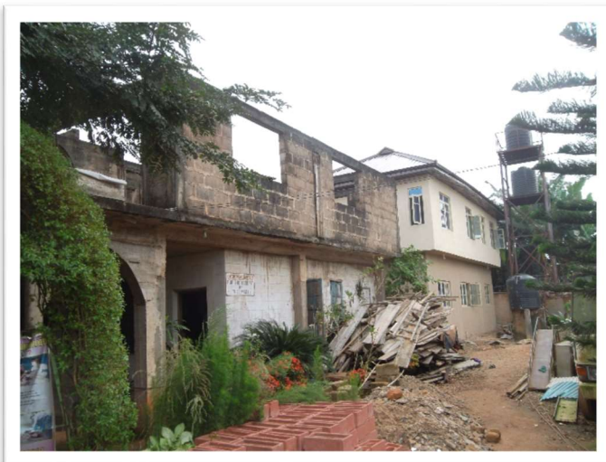
Hier is een dak nodig om de lokalen op de begane grond te beschermen tegen lekkage.