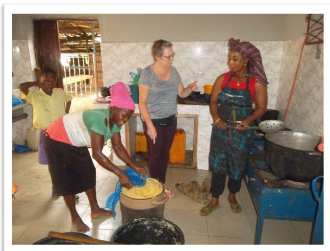
De dames zijn blij met de keuken.