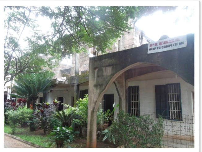
Dit gebouw vraagt om een dak.