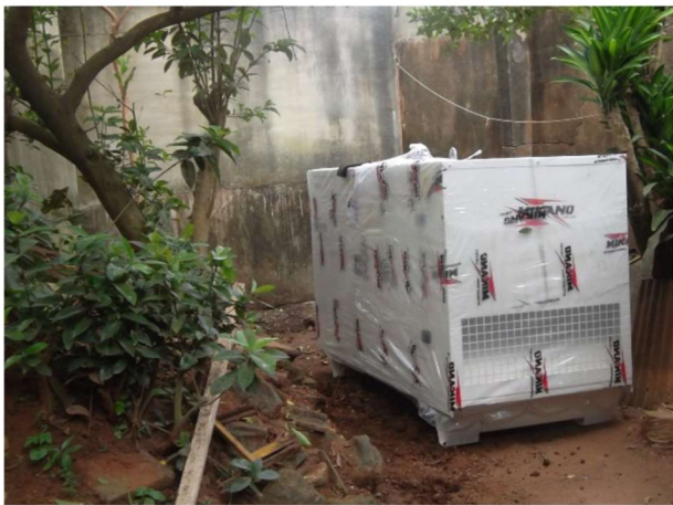
Hier nog ingepakt, nu draait de generator.