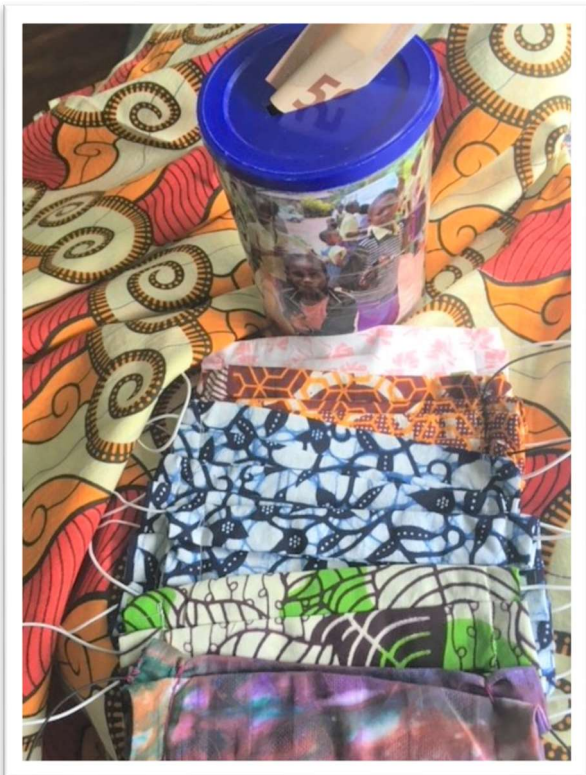
Te koop: mondkapjes met Afrikaans motief. Gemaakt door Adri Rodenburg.

Naast individuele donateurs kennen we instellingen die ons goed gezind zijn. Net vóór de Rijswijkse Oude en Nieuwe Kerk hun deuren moesten sluiten, waren we enkele weken projectdoel van de collecten. De diaconie heeft deze aangevuld tot een mooi bedrag. Ook de diaconie van Scheveningen vergat ons niet. In Het Westerhonk in Monster waren we jaarproject. Ook dit jaar hebben we aan de Pelgrimshoeve in Zoetermeer een bijdrage gevraagd.