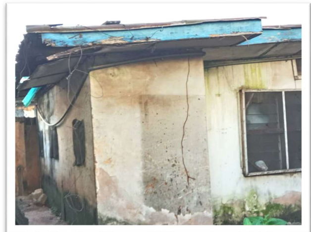
Accommodatie voor Youth Corpers voor de renovatie.