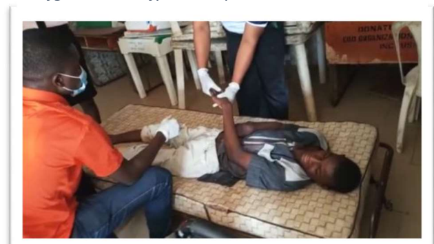
Één van de kinderen krijgt fysiotherapie.