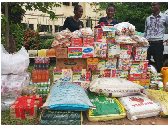
De voedselvoorraad bij Charilove is aangevuld.