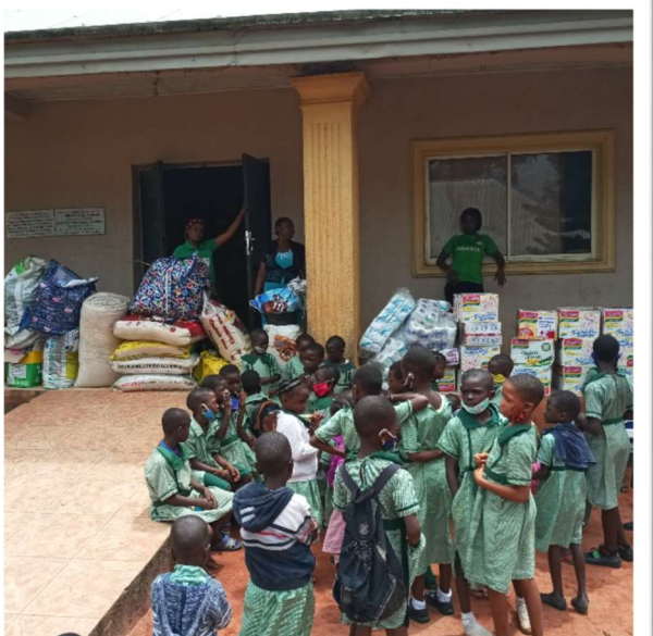
De kinderen in Ossiomo.