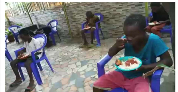
Op gepaste afstand je bord leeg eten.