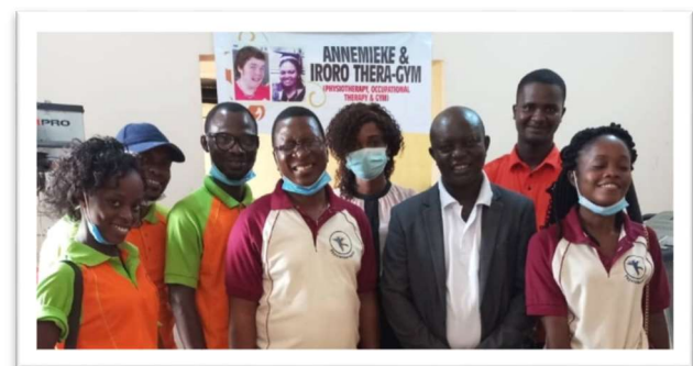
Afgestudeerde fysiotherapeuten met hun leraren.