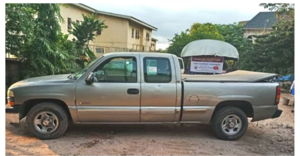
De pick-up truck voor o.a. voedseltransport naar Ossiomo.