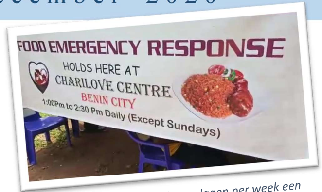
Sinds de lock-down wordt zes dagen per week een maaltijd verstrekt.