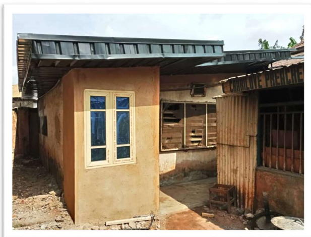
Accommodatie voor Youth Corpers na de renovatie.

Ook hebben we een bijdrage kunnen leveren aan een 2 e -hands transportauto, wat hard nodig was. Grote wens van Chris blijft een minibus voor ongeveer zestien personen, waarmee hij de kinderen kan vervoeren.