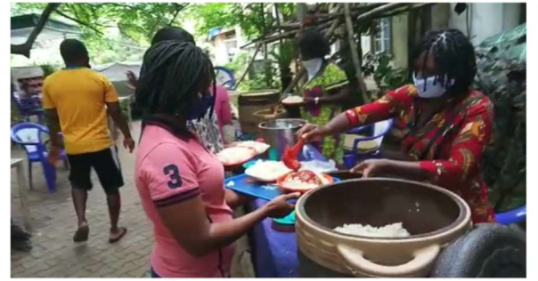
Uitdelen van de maaltijden.