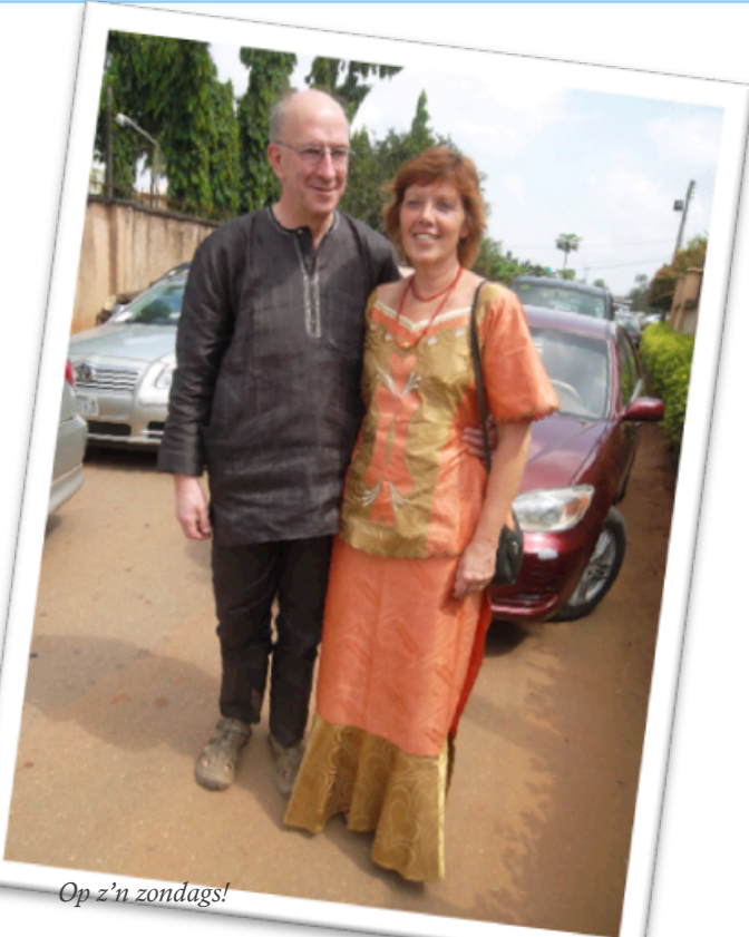
Op z'n zondags!