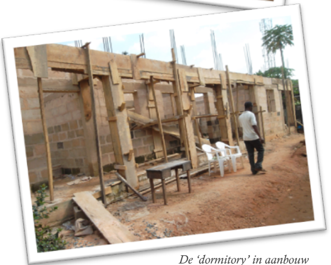
De 'dormitory' in aanbouw

Daarnaast was ik geraakt door een meisje dat vastgebonden aan een paal op een stoel moest blijven zitten. Het was een weglopertje en vanwege haar veiligheid koos men ervoor haar vast te binden. Het liefst was ik lekker met haar gaan wandelen maar dat wilde men liever niet. Samen hebben we toch leuke dingen kunnen doen, waarbij ze vooral genoot van zingen en lichamelijk contact.