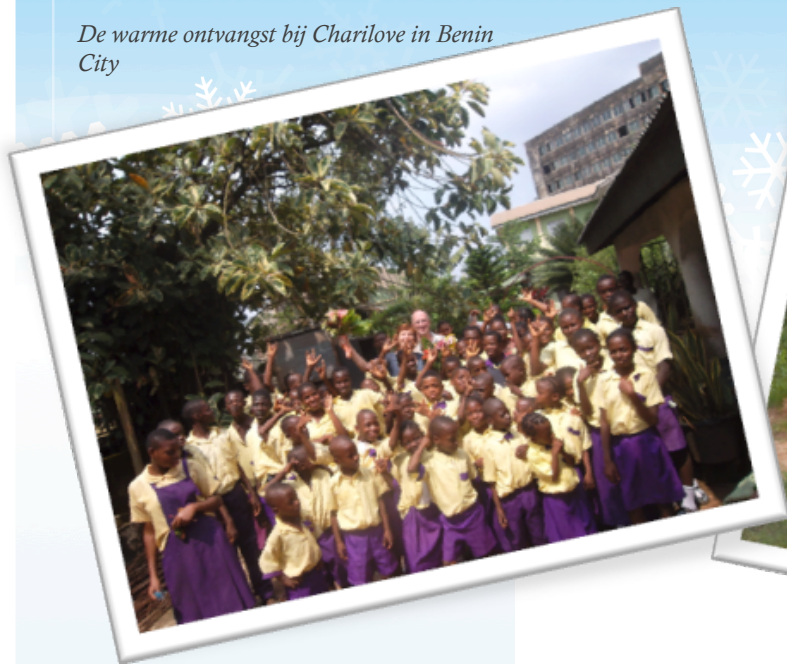
De warme ontvangst bij Charilove in Benin City